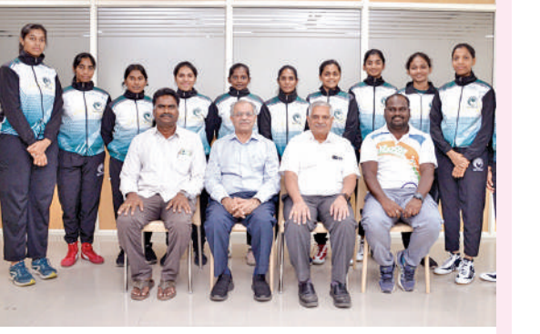
సాత్ జోన్ పోటీలకు ఎంపికైన గీతం కబడ్డీ జట్టు

పటానివెర, నవంబరు 28, ప్రభాతవార్త: అంతర్ విశ్వవిద్యాలయ కబడ్డీ మహిళా ఛాంపియన్ షిప్ 2024 కు పోటీ ప్రతిష్టాత్మకమైన దక్షిణ భారత అంతర్ విశ్వవిద్యాలయ కబడ్డీ మహిళా ఛాంపియన్ షిప్ 2024 25లో గీతం డివీషన్ విశ్వవిద్యాలయం బాలికల జట్టు ప్రాతినిధ్యం వహిస్తున్నట్లు క్రీడల డివ్యూటీ డైరెక్టర్ డాక్టర్ ఎం.నారాయణరావు వారి గురువారం విడుదల చేసిన ఒక ప్రకటనలో వెల్లడించారు. ఈ ఛాంపియన్ షిప్ తమిళనాడులోని కర్నూడిలోని అలగప్ప విశ్వవిద్యాలయంలో నవంబర్ 29 నుంచి డిసెంబర్ 2వ తేదీ వరకు జరుగుతుందన్నారు. ఎంతో ఆసక్తిగా ఎదురు చూస్తున్న ఈ పోటీలను భారతీయ విశ్వవిద్యాలయం ఆసానియేషన్, అలగప్ప విశ్వవిద్యాలయంలోని ఫిజికల్ ఎడ్యుకేషన్ డైరెక్టర్ ఆధ్వర్యంలో నిర్వహిస్తున్నారని తెలియజేశారు. గీతం కబడ్డీ జట్టు విశాఖపట్నం, హైదరాబాద్, బెంగళూరులో ఉన్న మూడు క్రీడాకారుల నుంచి వచ్చిన ప్రతిభావంతులైన అక్షయ్ యొక్క శక్తివంతమైన సమగ్ర శక్తిగా డాక్టర్ నారాయణరావు అభివర్ణించారు. కలిసమైన ఎంపిక ప్రక్రియను ఆసానియేషన్, జట్టు సభ్యులు తమ వైభవాన్ని, పోటీతత్వాన్ని ప్రాతినిధ్యం వేదికపై ప్రదర్శించడానికి ఎంపిక చేశామన్నారు. విద్యార్థులకు క్రీడలు, కార్యకర్తల ద్వారా విద్యార్థుల ప్రోత్సాహం కోసం నిబద్ధతకు ఇది నిదర్శనమని ఆయన పేర్కొన్నారు. టోర్నమెంట్ కోసం సన్నాహకంగా, గీతం ఉన్నతాధికారులు, స్పాట్స్ డైరెక్టర్ తదితరులు జట్టు సభ్యులకు తమ వృద్ధుల పూర్వక వర్ధంతి, ప్రోత్సాహాన్ని అందించడమే గాక జట్టు సామర్థ్యాలపై విశ్వాసం వ్యక్తం చేసినట్లు తెలిపారు. గీతం జట్టు విజయవంతమైన ఫలితంగా తిరిగి రావాలని వారంతా ఆకాంక్షించినట్లు ఆ ప్రకటనలో పేర్కొన్నారు.