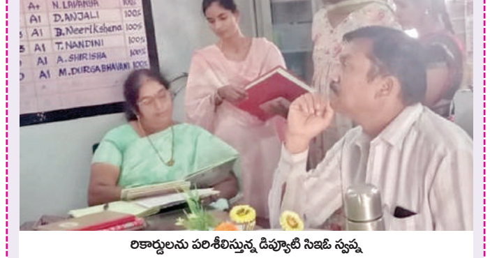
రెక్కాలను పరిశీలిస్తున్న డిప్యూటీ సెక్షి