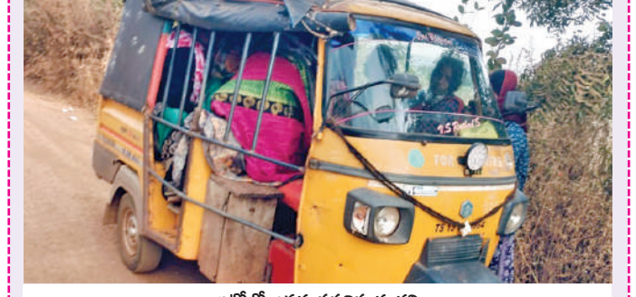
ఆటోలో బిడ్డను ప్రసవిస్తున్న తల్లి