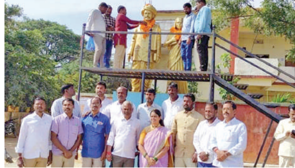
మహాత్మ జ్యోతిబాపూలే విగ్రహానికి నివాళులు అర్పిస్తున్న ద్వుక్రం