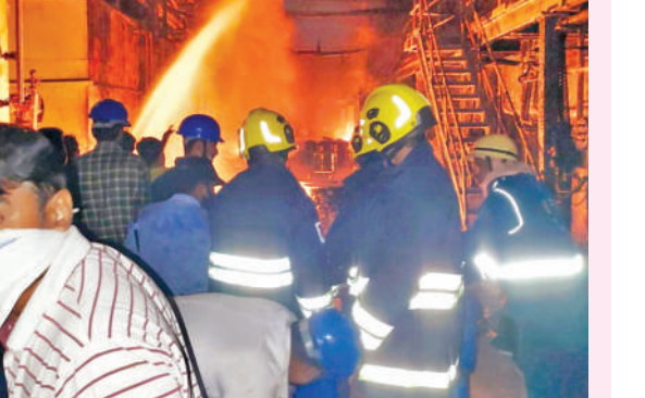
మంటలను ఆర్పుతున్న అగ్నిమాపక సిబ్బంది