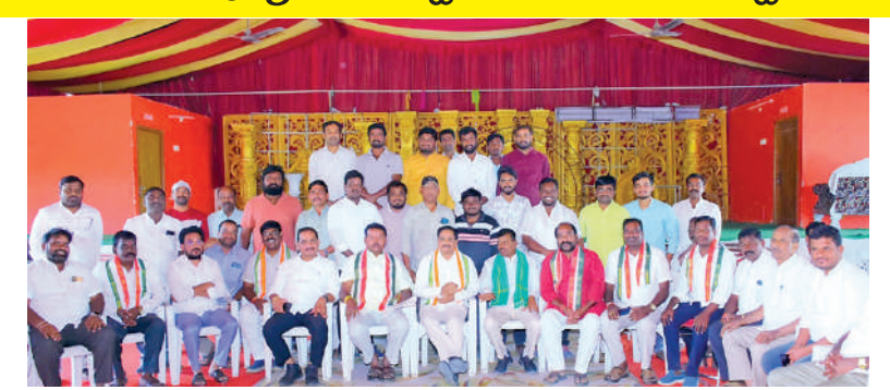
ఆమనగల్లులో విలేజరుల సమావేశంలో మాట్లాడుతున్న ఎమ్మెల్యే కె.వి.ఎస్. నారాయణరెడ్డి

రూ.2లక్షలకు చేసి ఘనమైన చరిత్ర సృష్టించిందని కొనియాడారు. 1000 స్పృహ మంజూరు... ఆమనగల్లు, మాడ్ల, తలకొండపల్లి, కర్ణాల మండలాలకు 1000 స్పృహ మంజూరు యార్జయని కలకత్తరి ఎమ్మెల్యే కె.వి.ఎస్. నారాయణరెడ్డి తెలిపారు. రూ. 7500 చెల్లించి సక్ష్మి డి.పి. స్పృహ మంజూరు అయిన వారికి రూ.7500 చెల్లించి దుర్వినియోగం చేసుకోకుండా పొదుపుగా