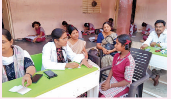
విద్యార్థులకు వైద్య పరీక్షలు నిర్వహిస్తున్న వైద్య సిబ్బంది