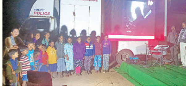
కనువిప్పు కార్యక్రమంలో అవగాహన కల్పిస్తున్న కళ్యాణం సంఘాలు