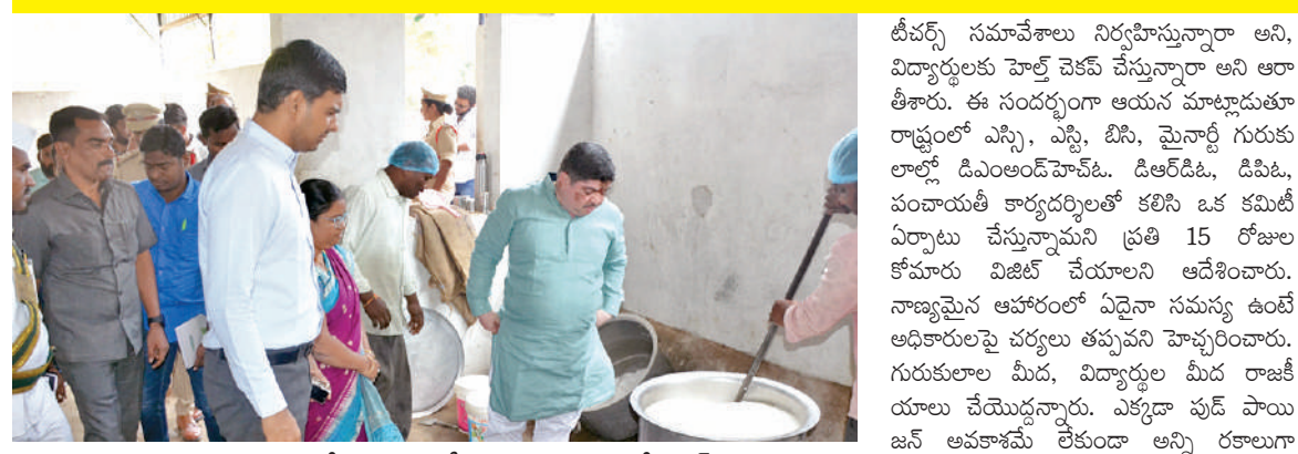
గురుకుల పాఠశాలలో వంటను పరిశీలిస్తున్న మంత్రి, చిత్రంలో కలెక్టర్

నాణ్యమైన ఆహారం అందించడంలో నిర్లక్ష్యం చేస్తే చర్యలు : మంత్రి పాన్నం ప్రభాకర్ గౌడ్