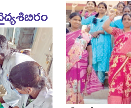
కెజిబి పాఠశాల ముందు నల్లబియ్యంతో నిరసన వ్యక్తం చేస్తున్న ఉపాధ్యాయులు